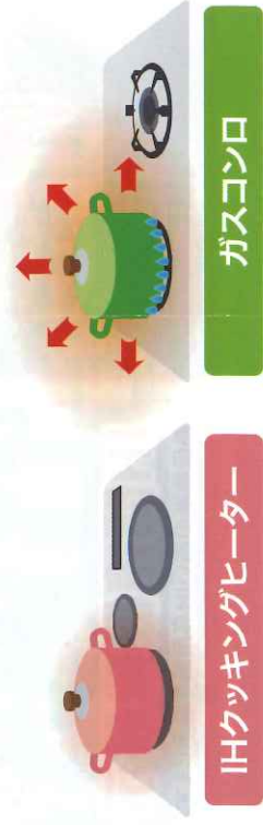
IHクッキングヒーター

火を使わないから、周囲の温度上昇を抑え、涼しく快適。換気回数も少なくてすむので、冷暖房費の節約にもつながります。